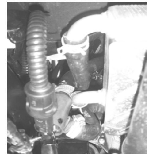
FORD Ranger 2.2 TDCi 2012-->